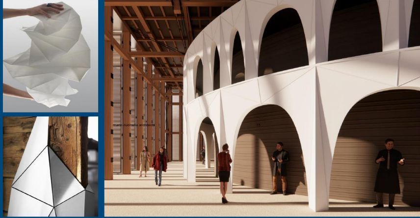
mario cucinella architects 14